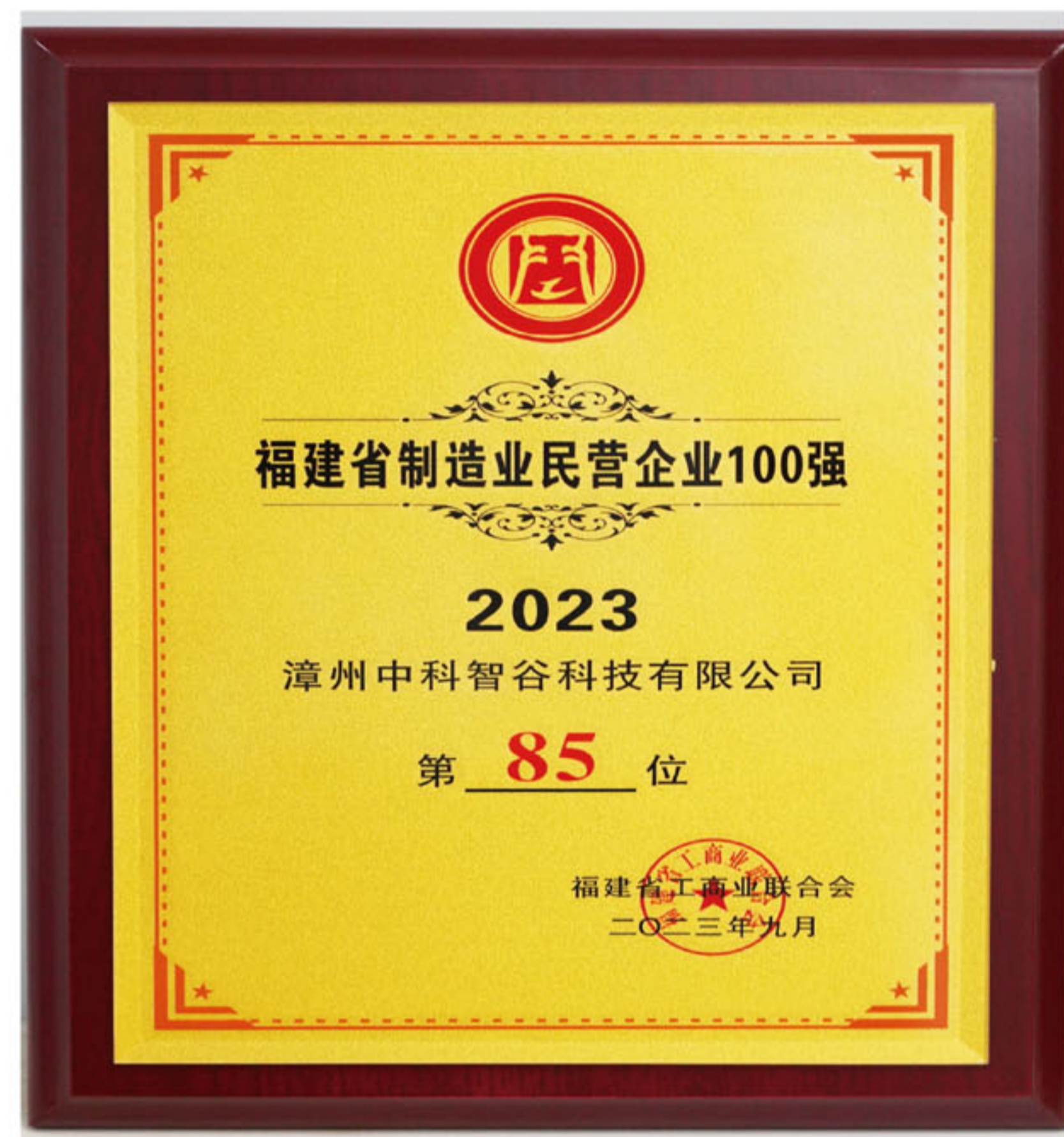
2023福建省制造业民营企业百强证书