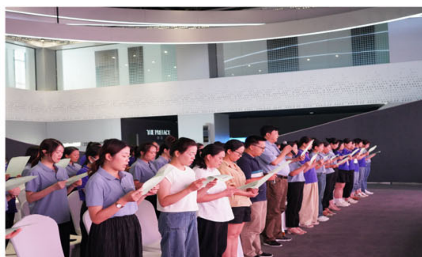
家庭教育公益大讲堂活动现场