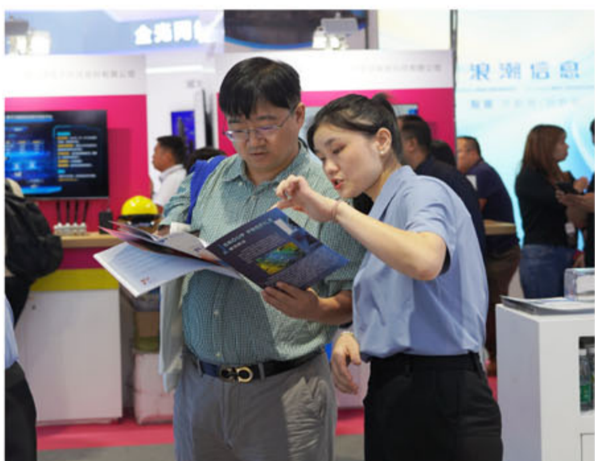
众多行业人士及观展嘉宾驻足参观