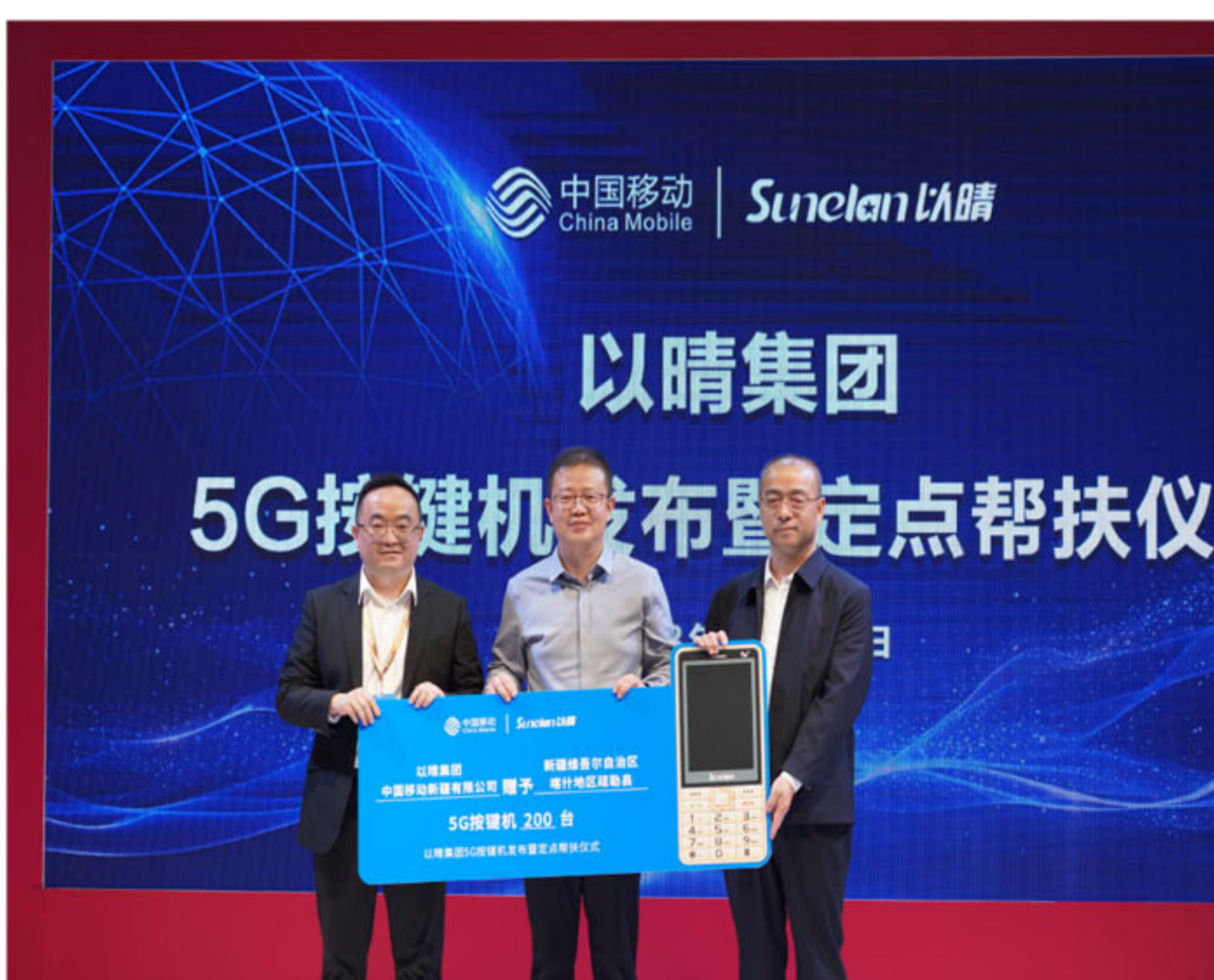
以晴5G按键机发布暨定点帮扶仪式活动现场