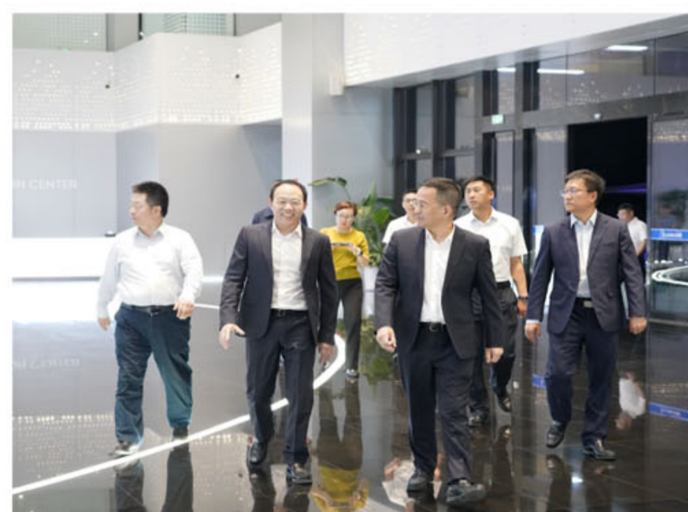
双方就企业相关情况进行交流讨论