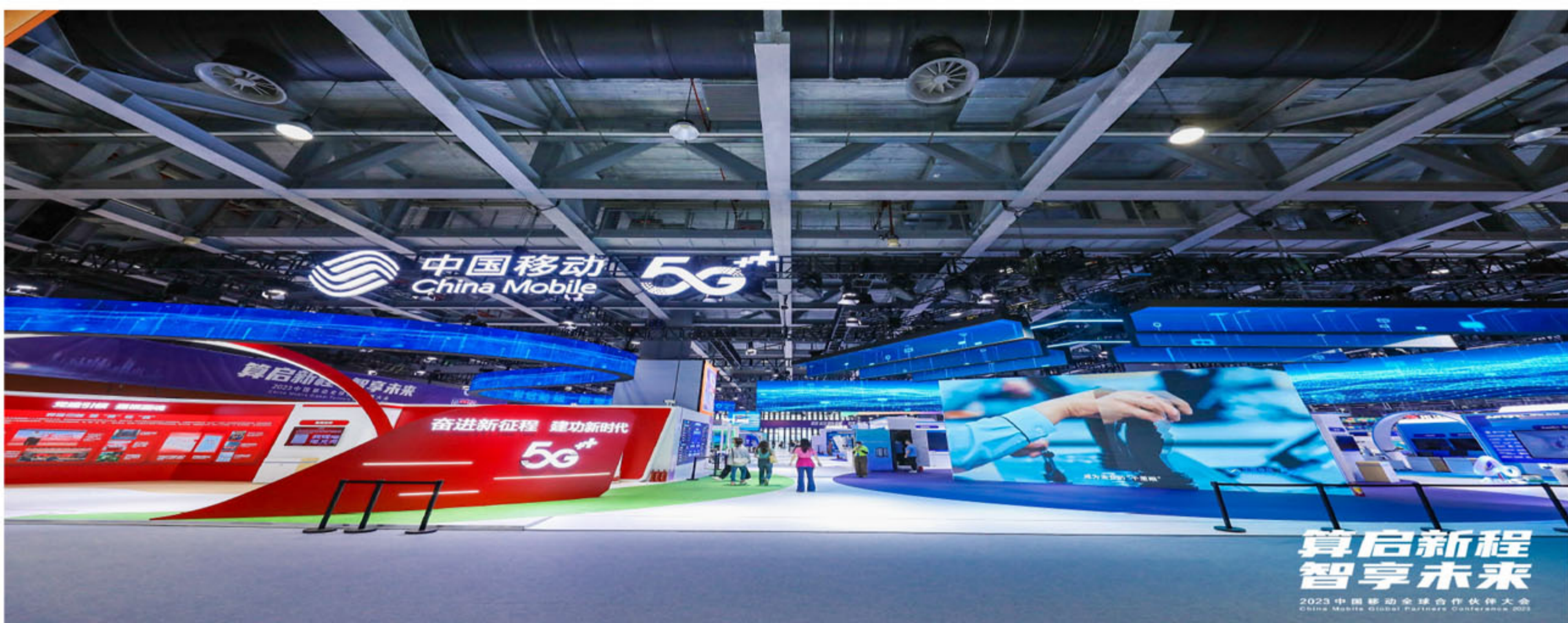
中国移动合作伙伴大会活动现场