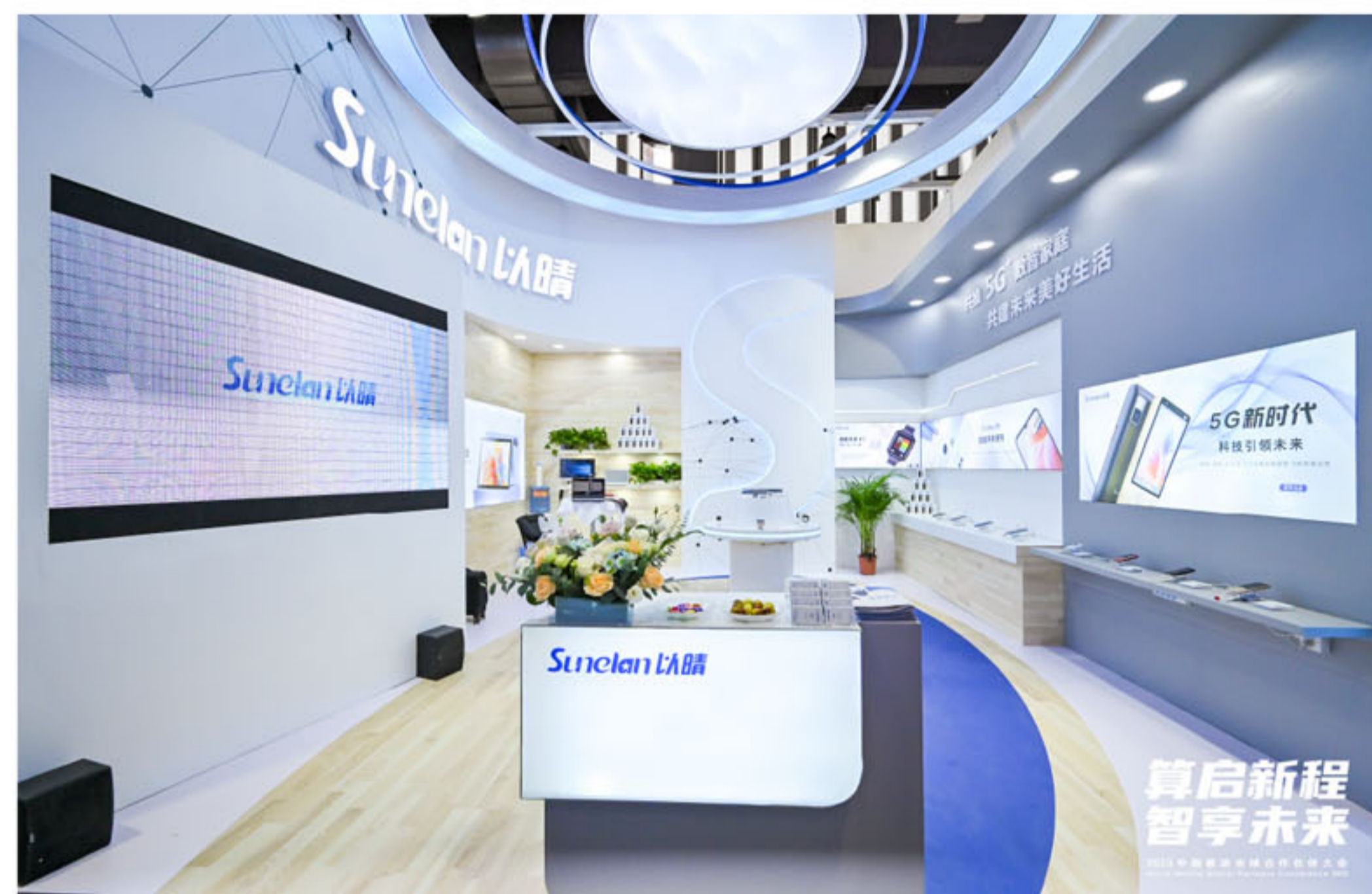
以晴集团参展现场

10月11-13日，第十一届中国移动全球合作伙伴大会在广州琶洲保利世贸博览馆隆重召开。此次大会以“算启新程，智享未来”为主题，全面展示中国移动5G+、算力、AI等领域最新技术创新，算力网络等新型基础设施最新解决方案，聚焦于推动数字经济与实体经济的深度融合，为加快构建新发展格局和推动高质量发展赋予新动能。