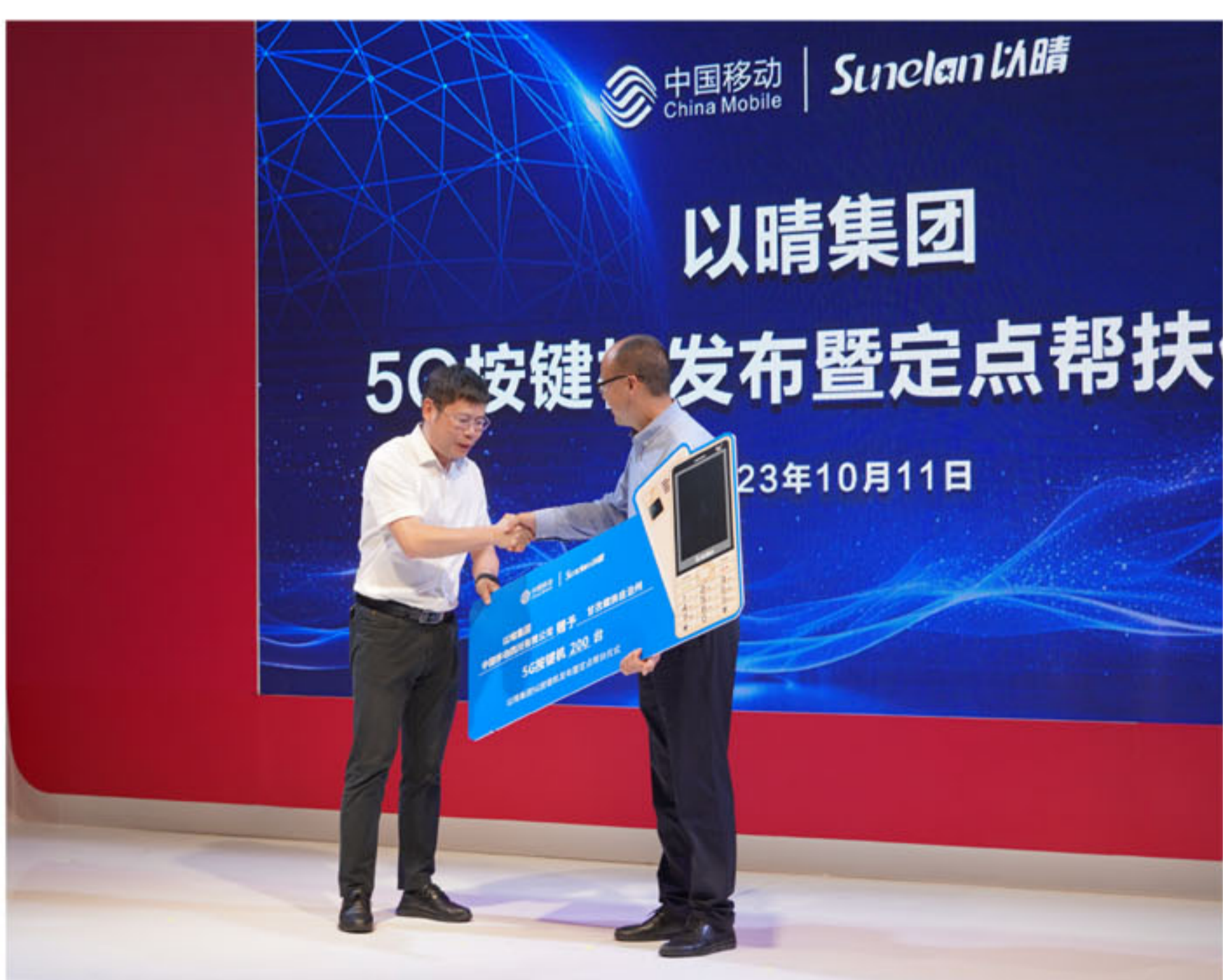
以晴5G按键机发布暨定点帮扶仪式活动现场

未来，以晴集团将与中国移动携手并进，与行业伙伴聚焦前沿科技，从技术、产品、解决方案等多维度积极响应国家信息技术应用创新发展战略，加快数字产业化、产业数字化进程，共同探索数智发展建设，共迎数字生活美好未来。