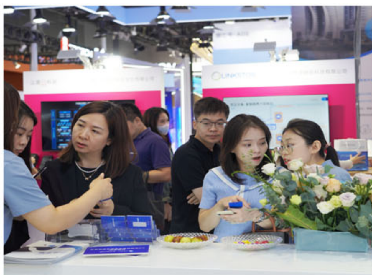
众多行业人士及观展嘉宾驻足参观