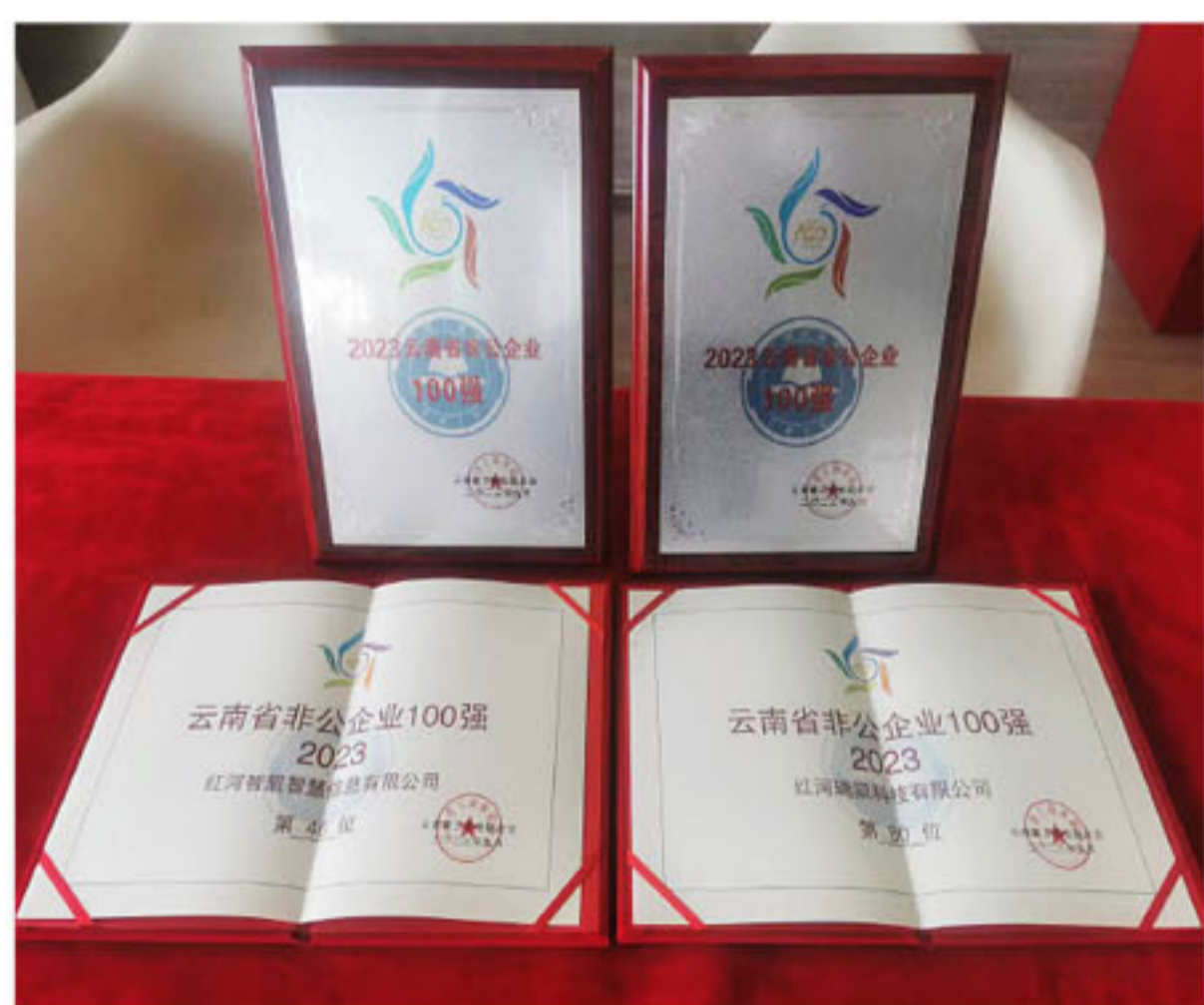
2023云南省非公企业百强证书