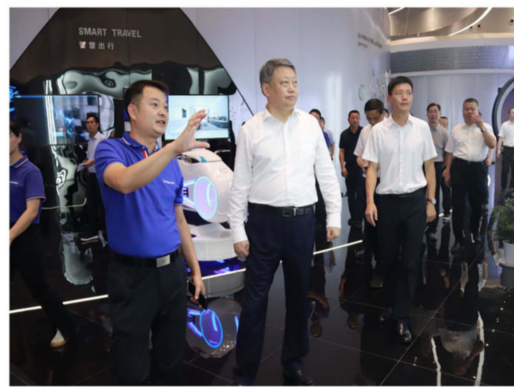
调研组实地查看企业产品展示厅