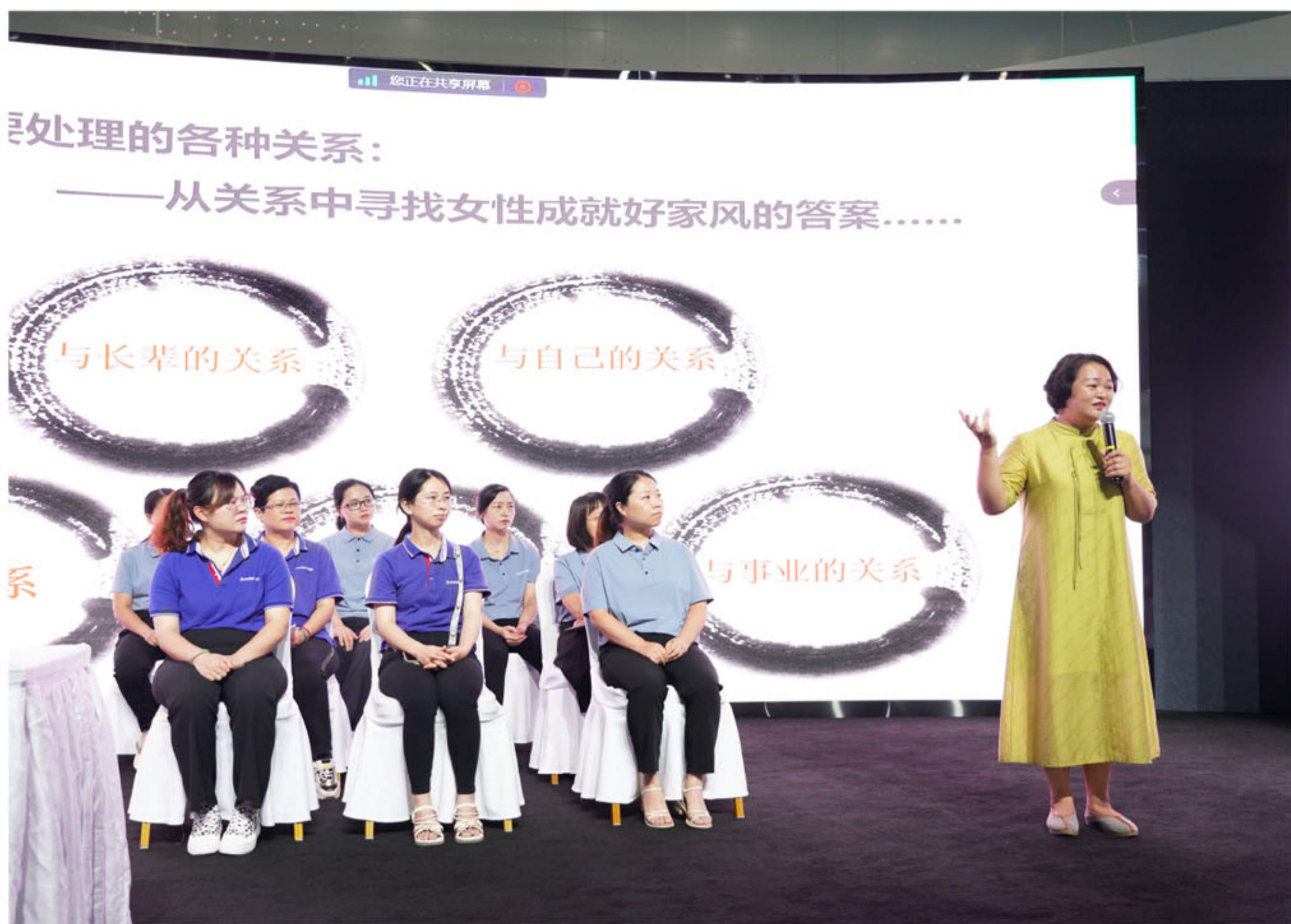
家庭教育公益大讲堂活动现场