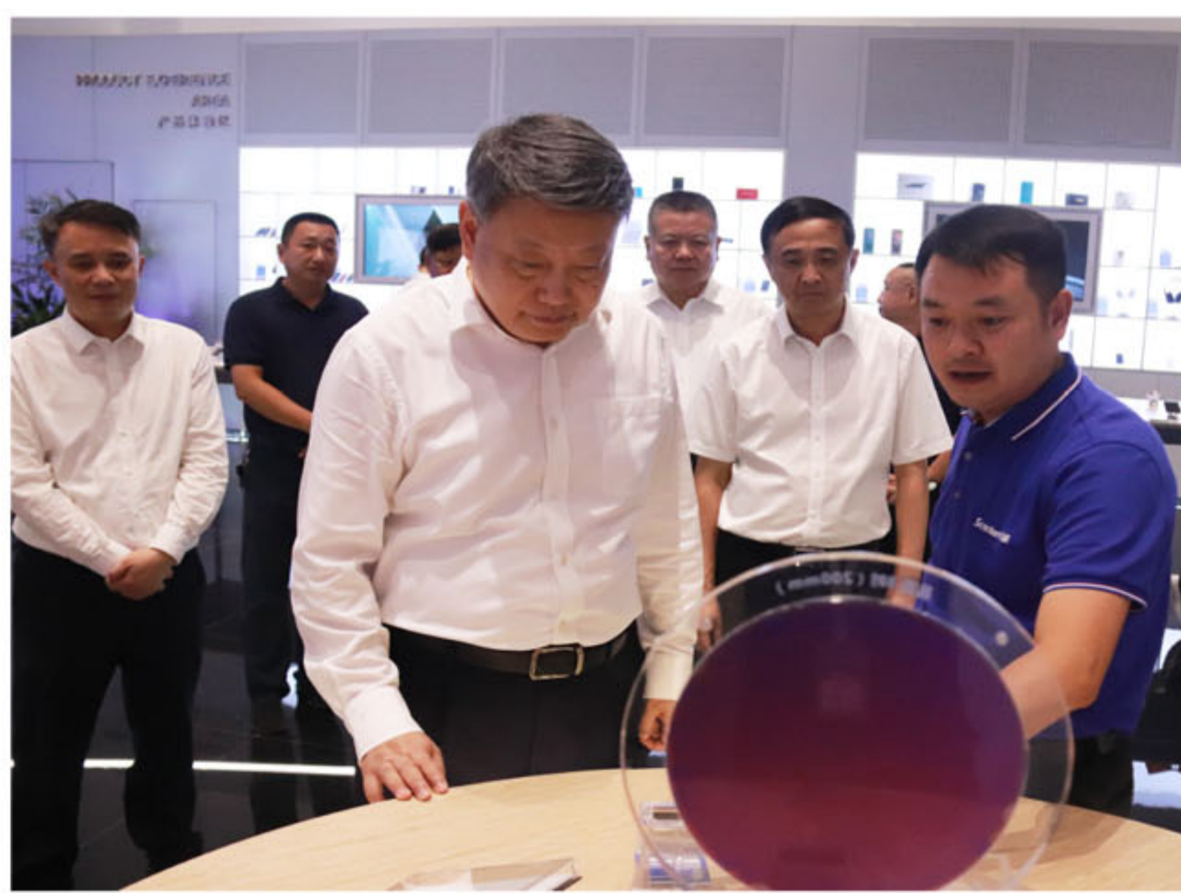
唐一军一行莅临江西以晴数字经济产业园调研

江西省政协秘书长彭世东，景德镇市人大常委会副主任、秘书长罗建国，浮梁县委副书记、县长张汉坤，县委常委、常务副县长段铨松，县政协党组书记、主席程文芳以及省、市、县相关单位主要负责同志参加此次调研活动，以晴集团外联中心总经理蔡国堂陪同调研。