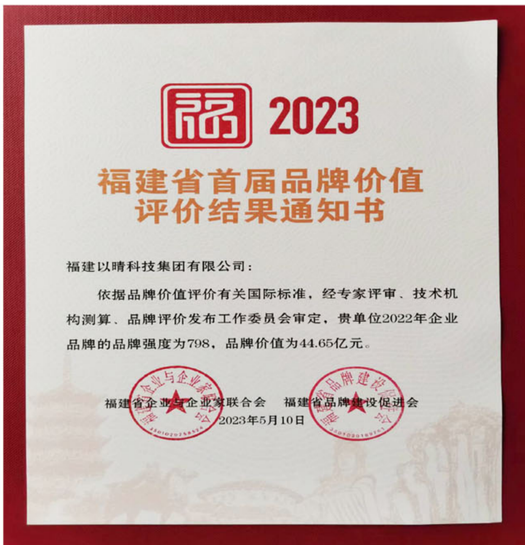
福建首届品牌价值评价证书

福建以晴科技集团有限公司荣获“福建省首届品牌价值评价证书”。据悉，这是福建省首次开展省级品牌价值评价，福建以晴科技集团有限公司以798的品牌强度、44.65亿元的品牌价值荣获“福建省首届品牌价值评价证书”。