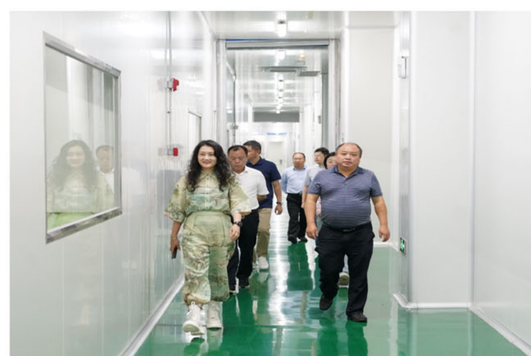
调研组实地查看企业生产车间

调研组一行来到企业生产车间及展厅，实地考察企业生产运营、工艺设计和技术研发等情况。